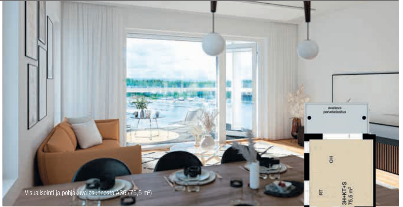
Visualisointi ja pohjakuva asunnosta A36 (75,5 m 2 )