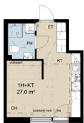
1 h+kt 27,0 m²

Varaa henkilökohtainen esittely sinulle sopivaan aikaan! Lue lisää: yit.fi/kranni