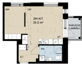
2 h+kt 35,0 m²