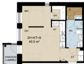
2 h+kt+s 40,5 m²