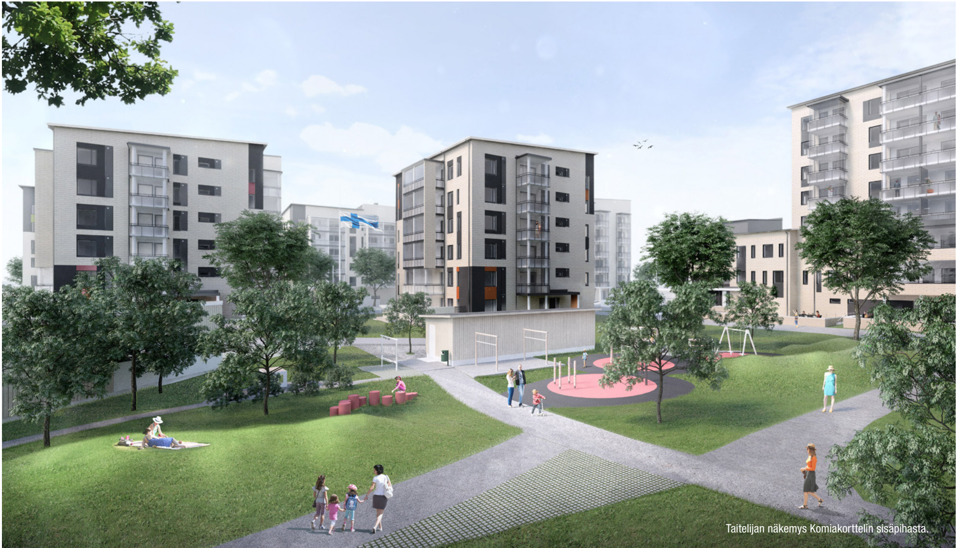
Taitelijan näkemys Komiakorttelin sisäpihasta.