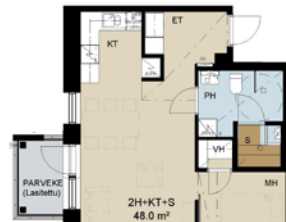
2 h+kt+s 48,0 m²