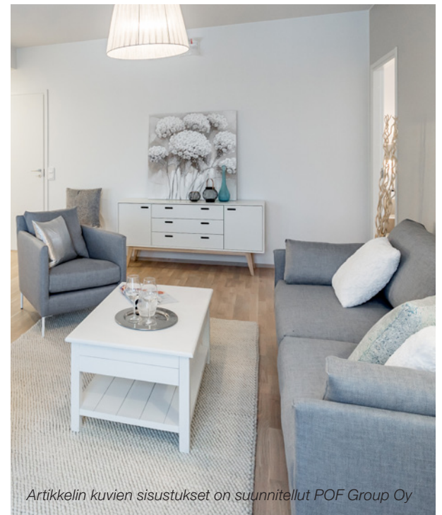
Artikkelin kuvien sisustukset on suunnitellut POF Group Oy

– Suomalaisten sisustusmaailma on tunnetusti kovin vaalea. Kannustankin kaikkia käyttämään iloisesti värejä ja lähtemään pois omalta mukavuusalueeltaan. Ajatusta voi kokeilla aluksi olohuoneessa vaihtamalla verhojen, sohvatyynyjen ja torkkupeiton väri omasta lempiväristä toiseen, Grönberg rohkaisee. ■