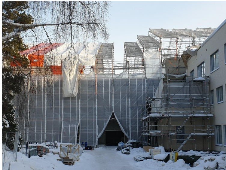
Kuvassa koulun 3. lohkon sääsuojauksen asennus

Tietoa hankkeesta ja kuukausittain ilmestyvät työmaatiedotteet löytyvät Espoon kumppanuuskoulujen sivuilta osoitteesta: https://www.yit.fi/espoonkumppanuuskoulut