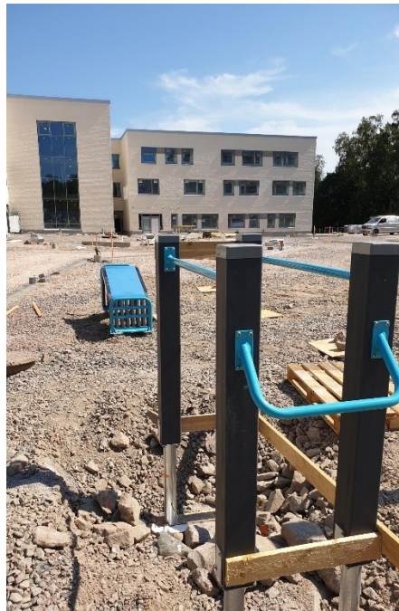
Pihalle on asennettu ensimmäiset urheiluvälineet

Tietoa hankkeesta ja kuukausittain ilmestyvät työmaatiedotteet löytyvät Espoon kumppanuuskoulujen sivuilta osoitteesta: https://www.yit.fi/espoonkumppanuuskoulut