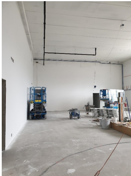
Pienen liikuntasalin tasoitus- ja maalaustyöt käynnissä.

Tietoa hankkeesta ja kuukausittain ilmestyvät työmaatiedotteet löytyvät Espoon kumppanuuskoulujen sivuilta osoitteesta: https://www.yit.fi/espoonkumppanuuskoulut