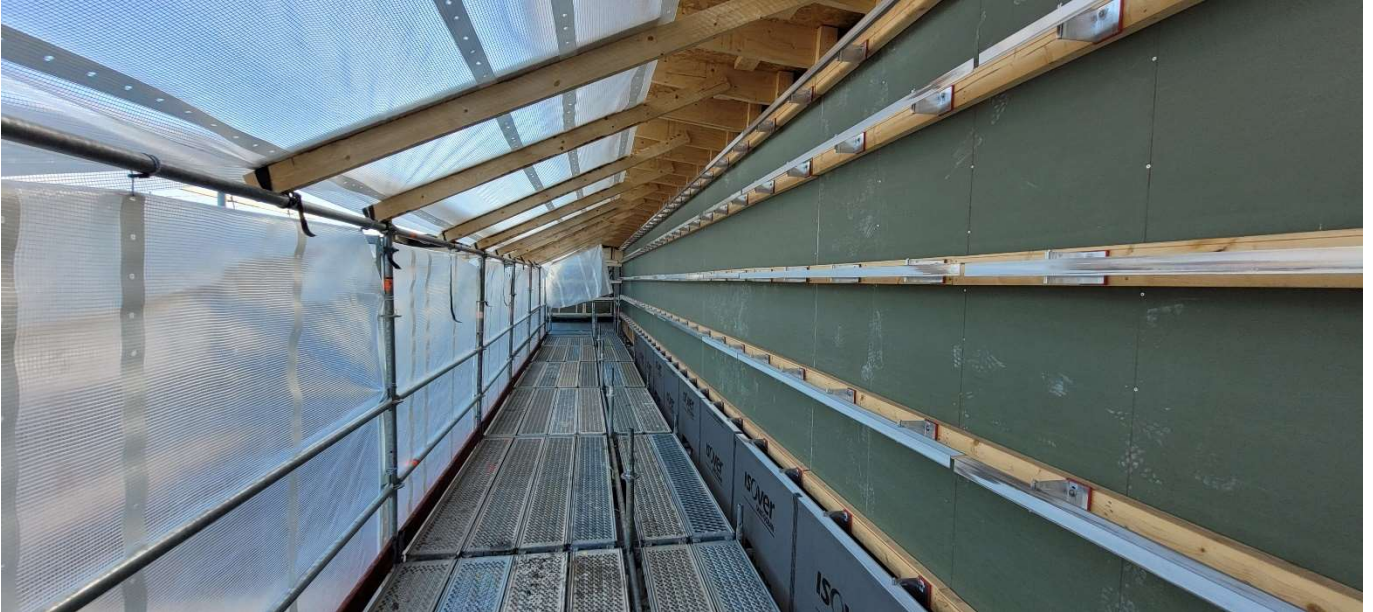
Levyjulkisivun asennukset käynnistyneet