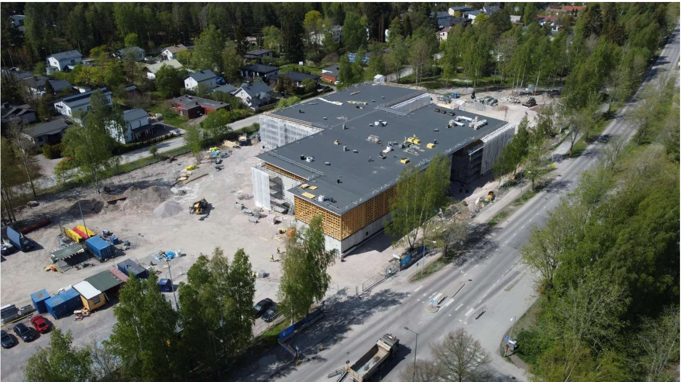
Koulun vesikattotyöt valmistumassa