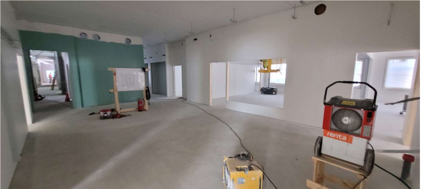
Tasoite- ja maalaustyöt käynnissä sisäpuolella.