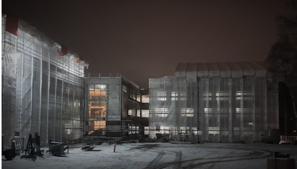
Kuvassa 2. lohkon sääsuojausten asennus

Tietoa hankkeesta ja kuukausittain ilmestyvät työmaätiedotteet löytyvät Espoon kumppanuuskoulujen sivuilta osoitteesta: https://www.yit.fi/espoonkumppanuuskoulut