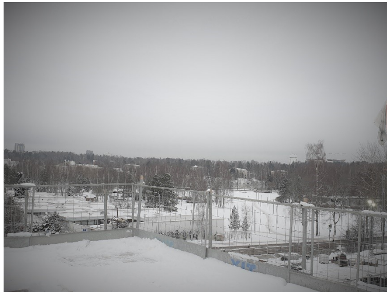
Kuvassa koulun katolta avautuva talvinen maisema

Tietoa hankkeesta ja kuukausittain ilmestyvät työmaatiedotteet löytyvät Espoon kumppanuuskoulujen sivuilta osoitteesta: https://www.yit.fi/espoonkumppanuuskoulut